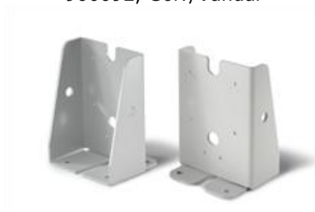
128 x 95 x 80 mm