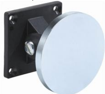
900091, Väggfäste, 300mm