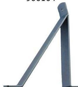
255 x 220 x 40 mm